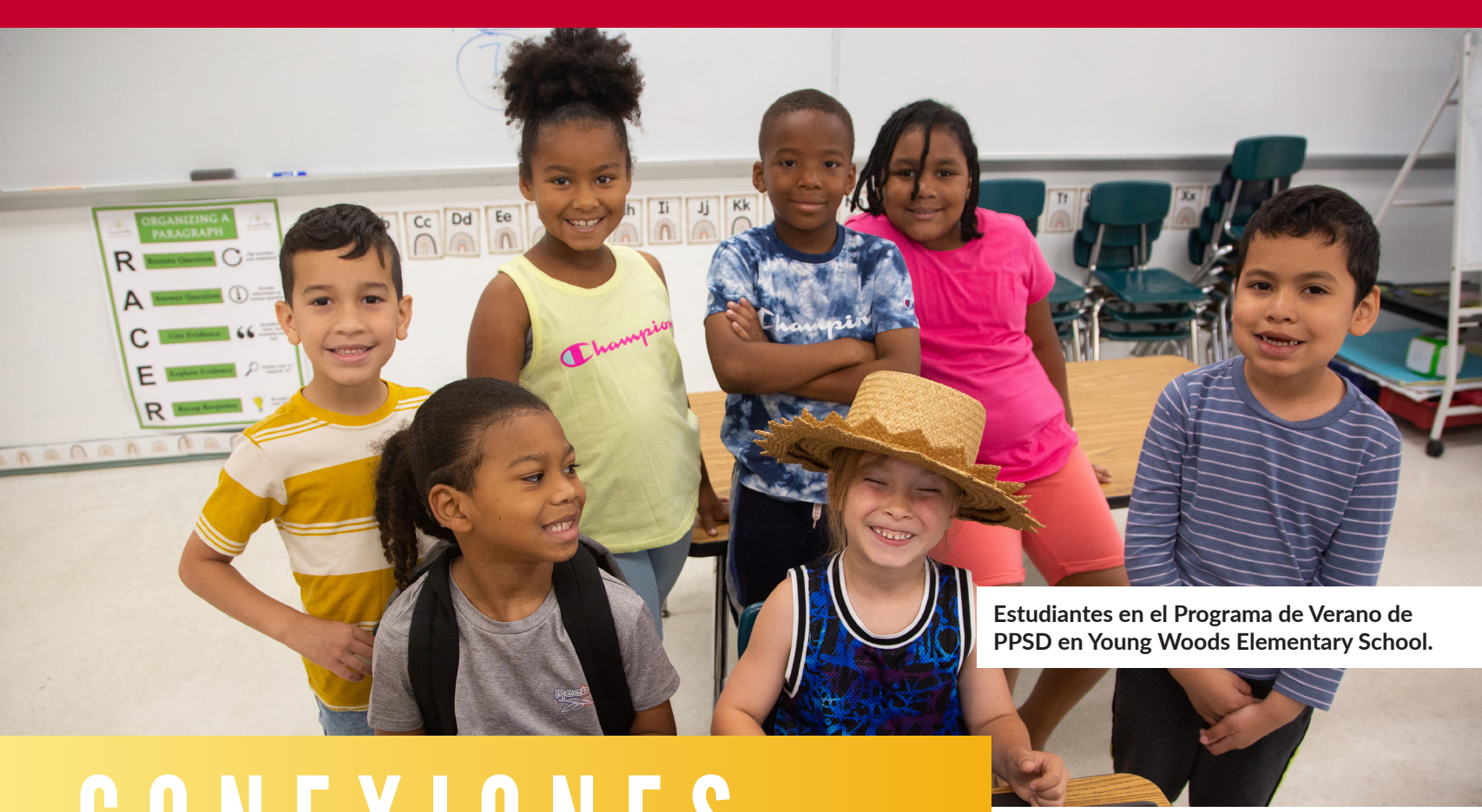
Estudiantes en el Programa de Verano de PPSD en Young Woods Elementary School.